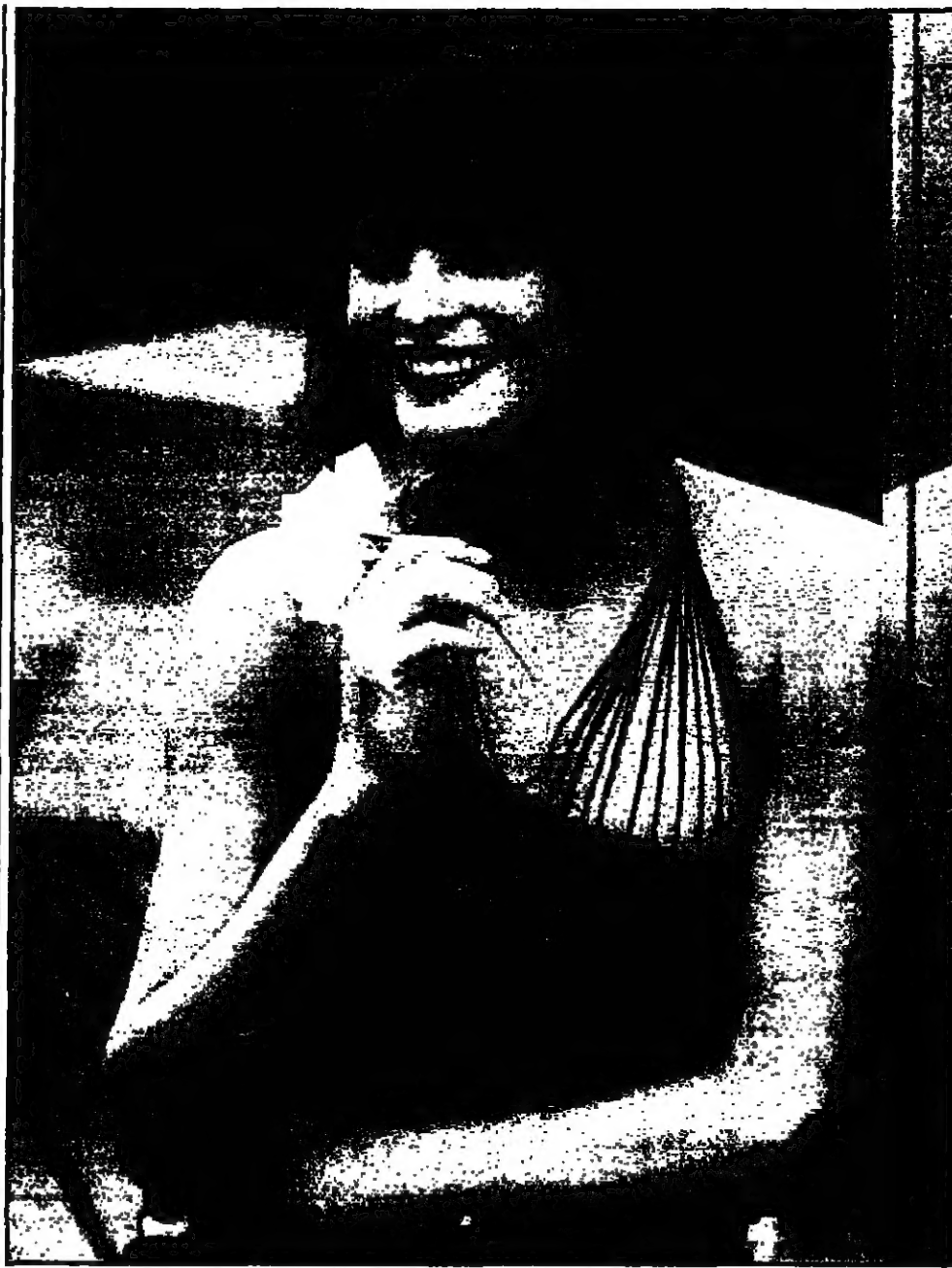
عارضة الأزياء المصرية لينا إيجان... عارضة الأزياء المصرية لينا إيجان...